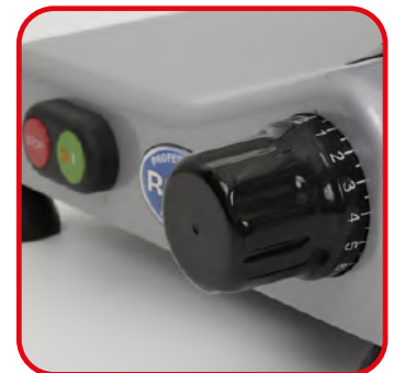
Manopola graduata ed interruttore per centralina CEV. Graduated knob and switch linked to CEV control unit.