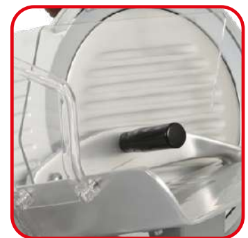
Pressamerce con protezione in plexiglass. Food-holder arm with protection in plexiglass.