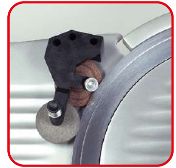
Affilatoio amovibile incluso. Removable sharpener included.